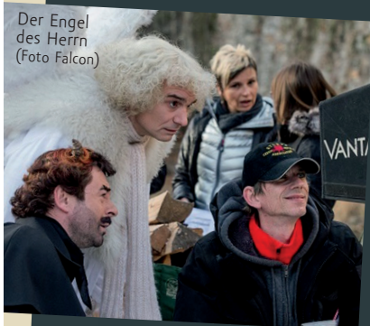
Der Engel des Herrn

ganztägige Vorführung der Böhmerwaldfilmen