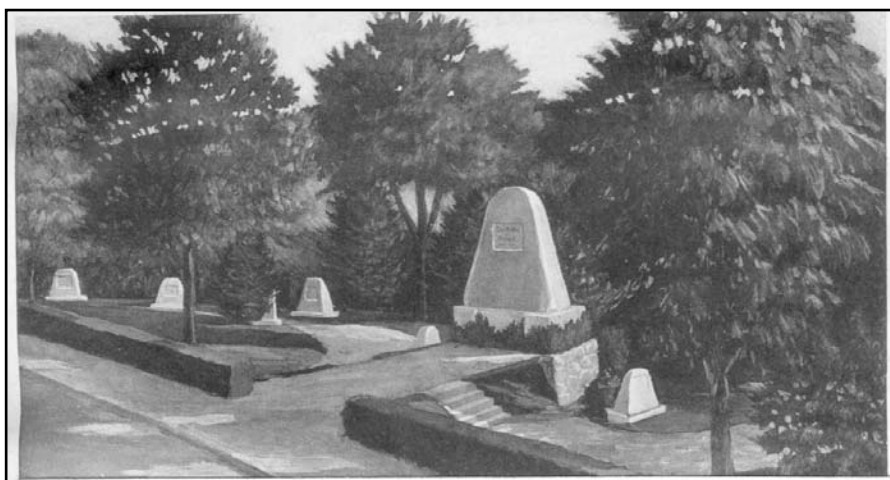
Pomník padlých v 1. svět. válce v Kašperských Horách, dobová pohlednice z doby před 1930