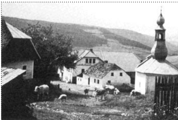
Vesnička Opolenec leží 3 km severozápadně od Kašperských Hor

Autor slovníku místních jmen v Čechách Antonín Profous odvozuje název obce od přídavného jména „opolený“ – ohořelý (dvůr). Uvádí i výklad, podle něhož by se mohlo jednat o utvoření od jména „opel“ nebo „Apel“, což je prý krátká forma jména Albrecht. Počátky osady se dávají do souvislosti s místní těžbou zlata a horským zemědělstvím. Podél Opoleneckého potoka, který protéká údolím pod osadou a ústí u Radešova do Otavy, se místy dochovaly kopečky šterku a písku, zvané sejpy, které zde zbyly po středověkém rýžování zlata.