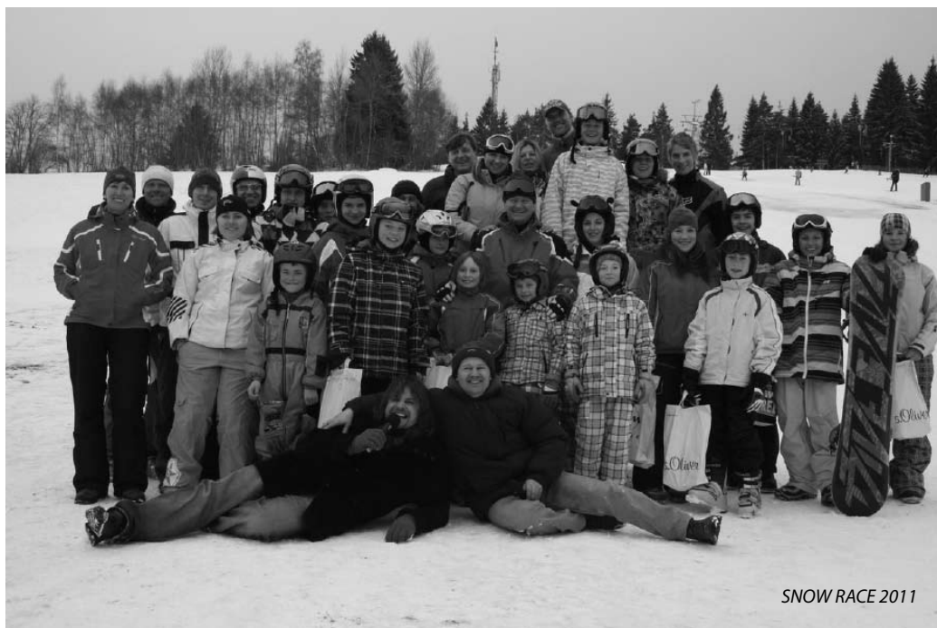
SNOW RACE 2011

PS: Fotografie z těchto závodů můžete vidět na stránkách LO TJ K.Hory www.skiteam.blog.cz