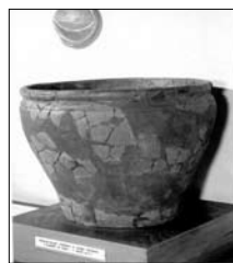
Rýžovnice – z nálezů na Sedle