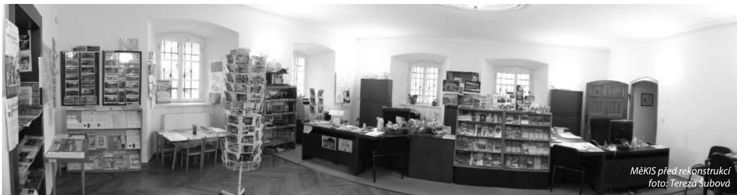
MĚKIS před rekonstrukcí