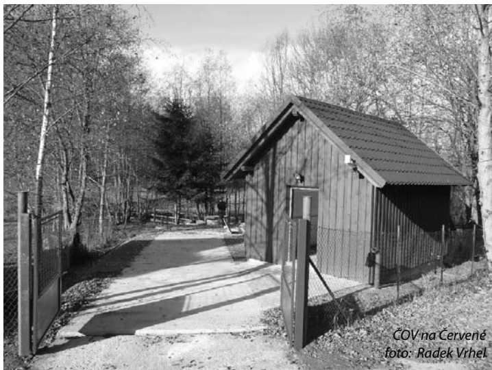
ČOV na Červené

Abych svá tvrzení o něco opřel, uvedu zde pár čísel pro představu, jak nám ta voda „zadarmo“ do města přitéká. Za loňský rok bylo z rozpočtu města vynaloženo na běžný provoz dodávky pitné vody 1,042 tis. Kč. V tom je započtena i jedna zajímavá částka ve výši 270 tis. Kč za poplatek odběru podzemních vod, který platíme státu (2,- Kč/m 3 ). Navíc jsme provedli opravu - sanaci dvou komor vodojemu Ždánov za 633.120 Kč, spojenou s výměnou šoupat a spojek za dalších 78.703 Kč.