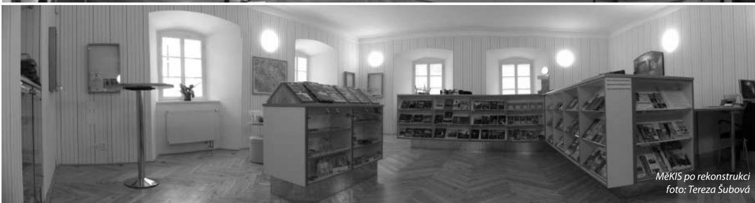
MĚKIS po rekonstrukci