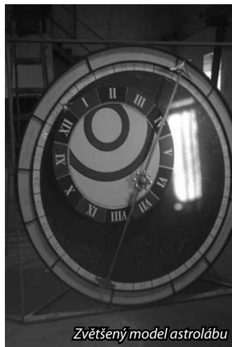
Zvětšený model astrolábu